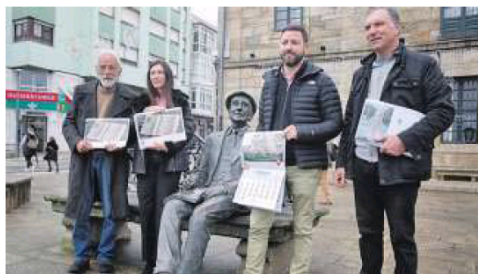
Acto de presentación del calendario, ayer en Cambados.

Además de los superhéroes americanos, en esta ocasión a la cabalgata se sumará también Papá Noel, «xa que non puido visitar a pé os establecementos de Barrantes, nin tampouco percorrer os establecementos de Ribadumia na súa carruaxe debido ás malas condicións climatolóxicas» del día en que debía hacerlo. Papá Noel ha decidido volver, fuera de su fecha habitual para visitar Ribadumia antes de volver a Laponia.